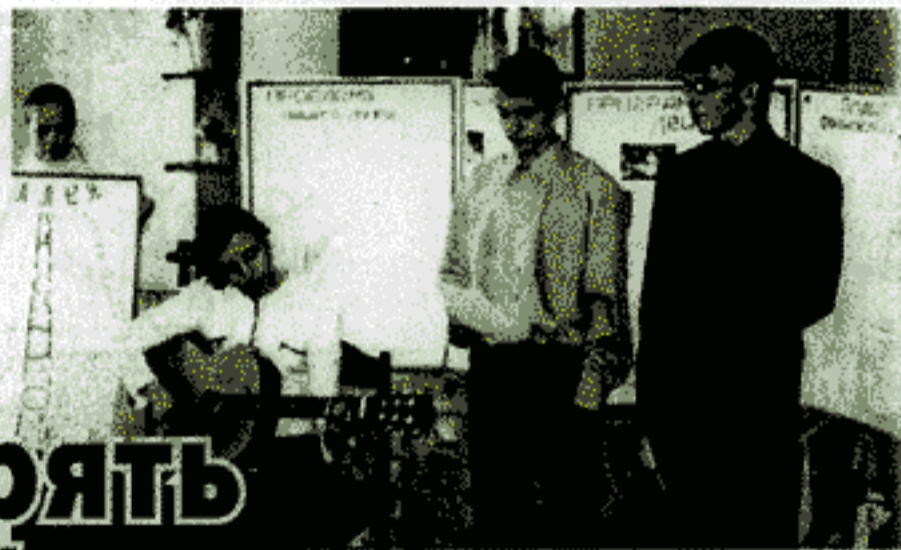
Воспитанники детского дома представляют проект «Аллея выпускников».

Подготовкой трасс и судейством на лыжных гонках занимались специалисты городской спортивной школы. Спартакиада воспитанников детских домов, которую по праву можно отнести к разряду областных мероприятий, – не первое интересное начинание новодвинцев.