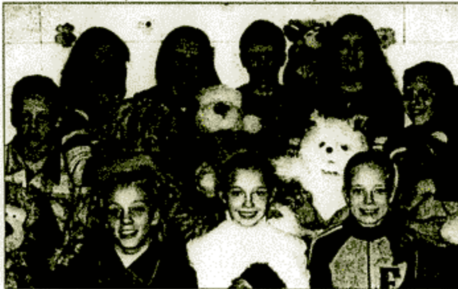
Воспитанники Новодвинского детского дома