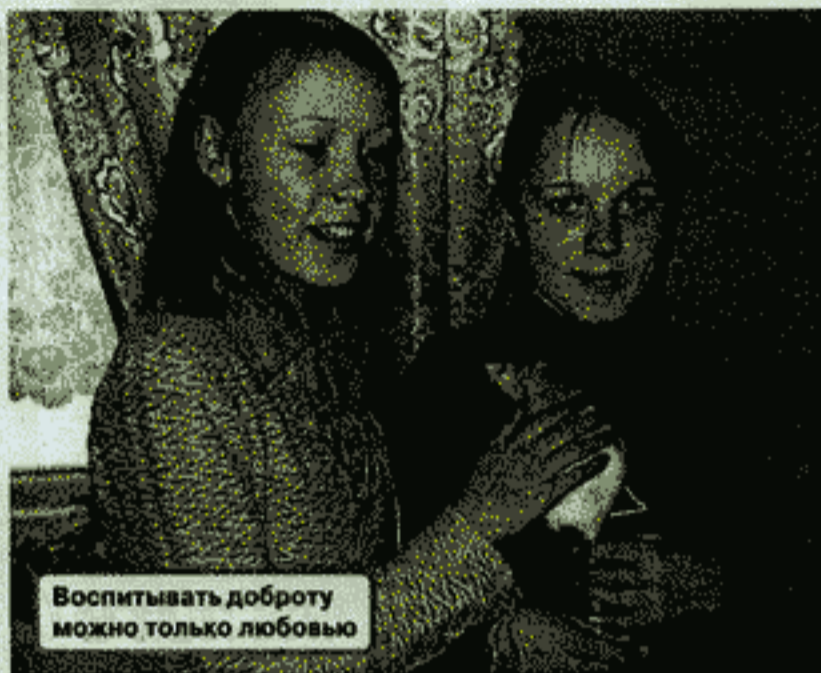
Воспитывать доброту можно только любовью

Пошел уже четвертый год с тех пор, как бывший Новодвинский детский интернат получил статус Детского дома со всеми вытекающими отсюда последствиями. А многие официальные лица продолжают считать учреждение интернатом.