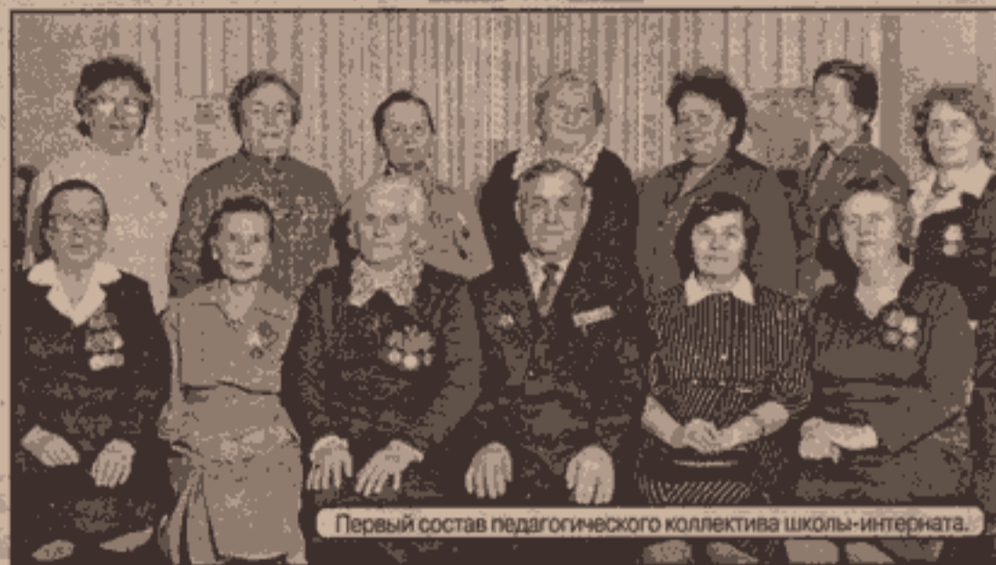
Первый состав педагогического коллектива школы-интерната.