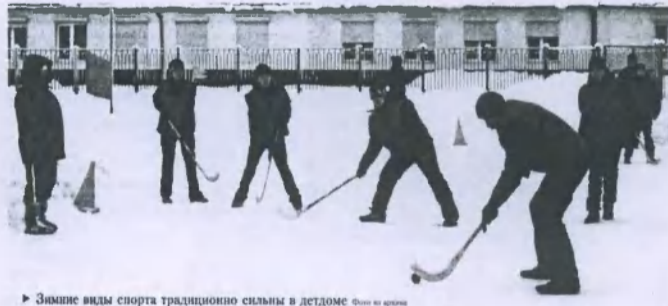
Зимние виды спорта традиционно сильны в детдоме