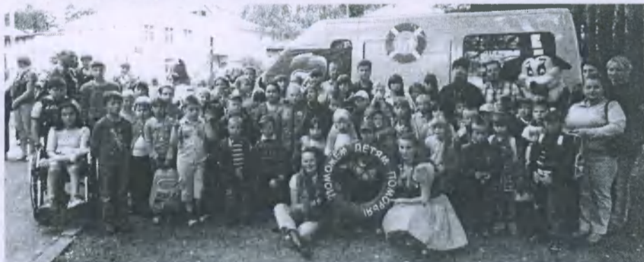
► Участники автопробега и воспитанники детского дома

Из Новодвинска машины с подарками ребятишкам проехали почти всю область и на базе Вельского Центра социальной помощи семье и детям благотворители