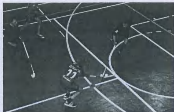
Команда Новодвинска в атаке

Эти соревнования стали настоящим событием для детей, принимавших в них участие. Такие мероприятия важны не только тем, что развивают ребят физически, но, самое главное, помогают воспитанникам детских домов, инком-интернатов адаптироваться, говоря языком