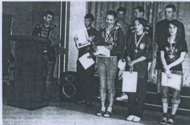
Воспитанники детдома – частые призёры городских соревнований

Спортом в детском доме занимаются все воспитанники