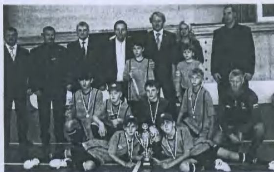
Команда-победитель с губернатором