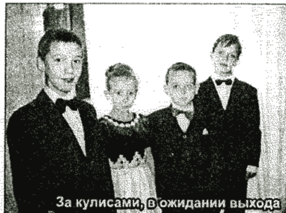
За кулисами, в ожидании выхода